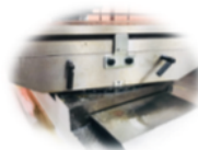
Mesa 1000x240mm Angular a 45°