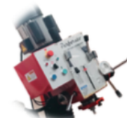
Cabezal engrando Angular a 45°