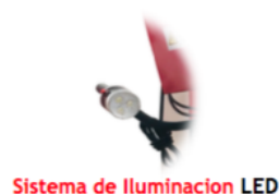
Sistema de Iluminación LED